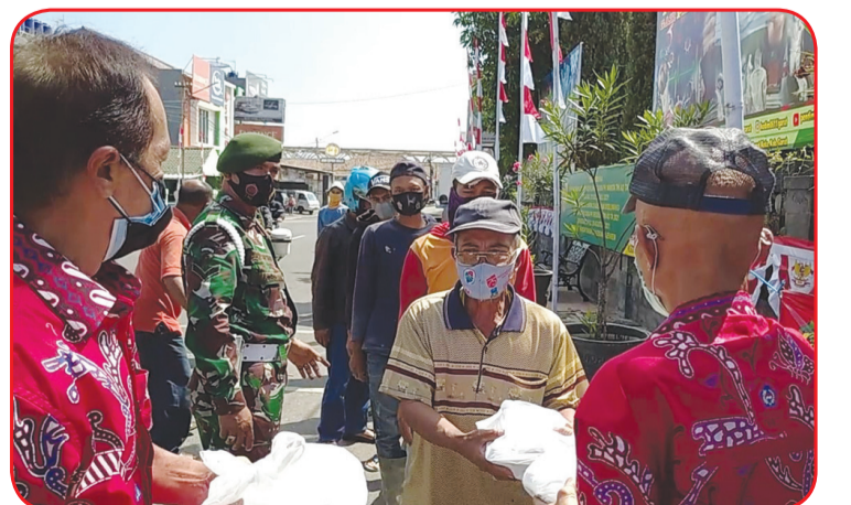
Suasana bakti sosial yang diselenggarakan PSMTI Garut.