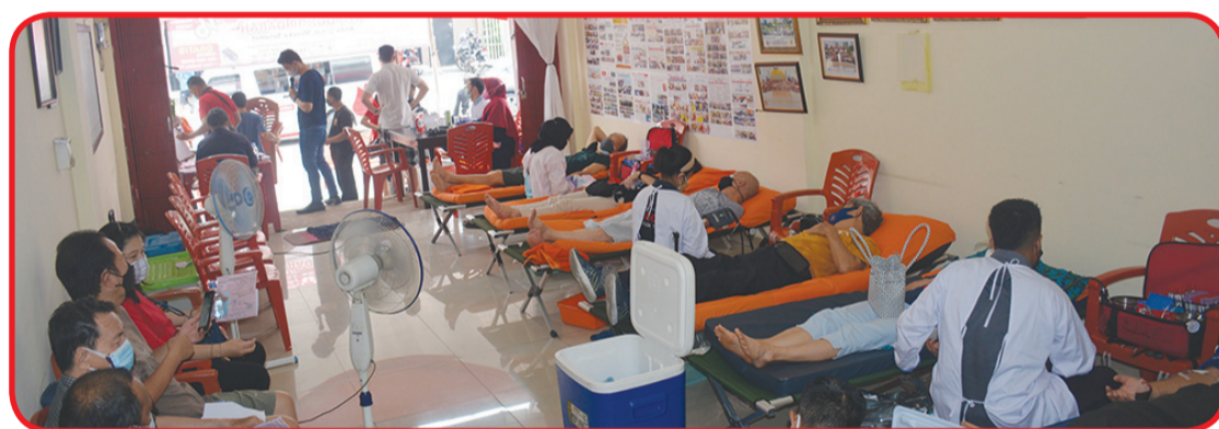
Suasana donor darah yang berlangsung lancar.