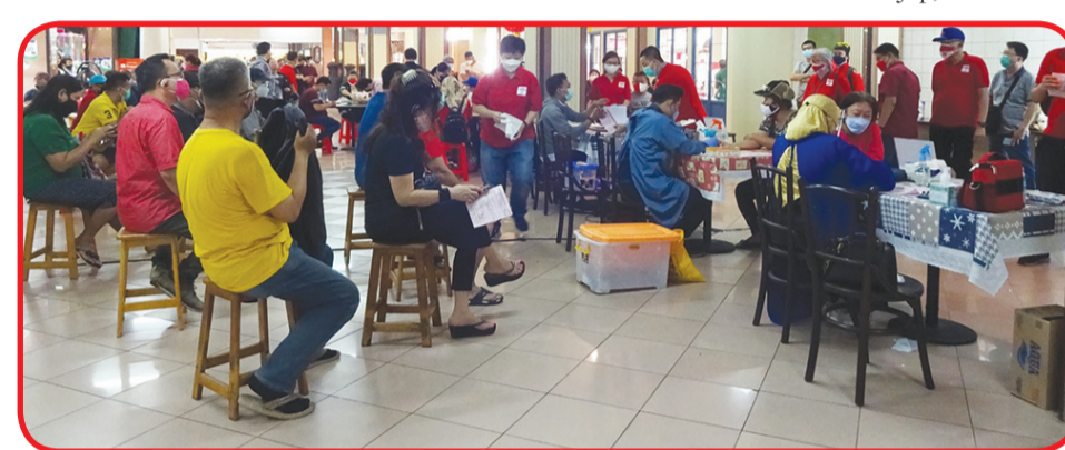
Suasana donor darah berlangsung.

ta pendaftar melebihi target kantong tersedia dari target yang ditentukan sebanyak 100 orang.