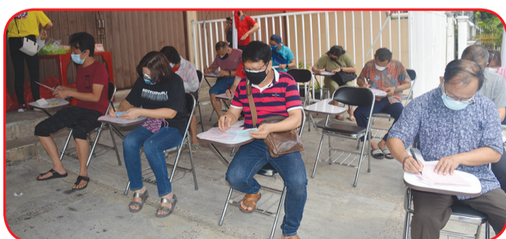
Masyarakat mengantri untuk mendonorkan darahnya.