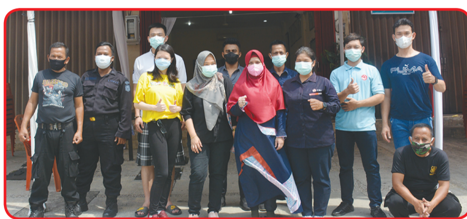
Relawan YEMI berfoto bersama petugas PMI DKI Jakarta.

Pada donor darah kali ini, antusias masyarakat yang ingin mendonorkan darahnya begitu tinggi.