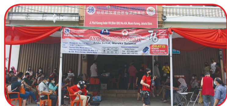
Lokasi donor darah yang menerapkan protokol Kesehatan.